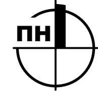
Схема інженерного обладнання території М1:5000