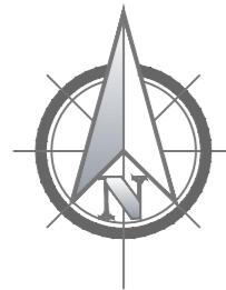
Схема інженерних мереж, споруд і використання підземного простору План М 1:1000